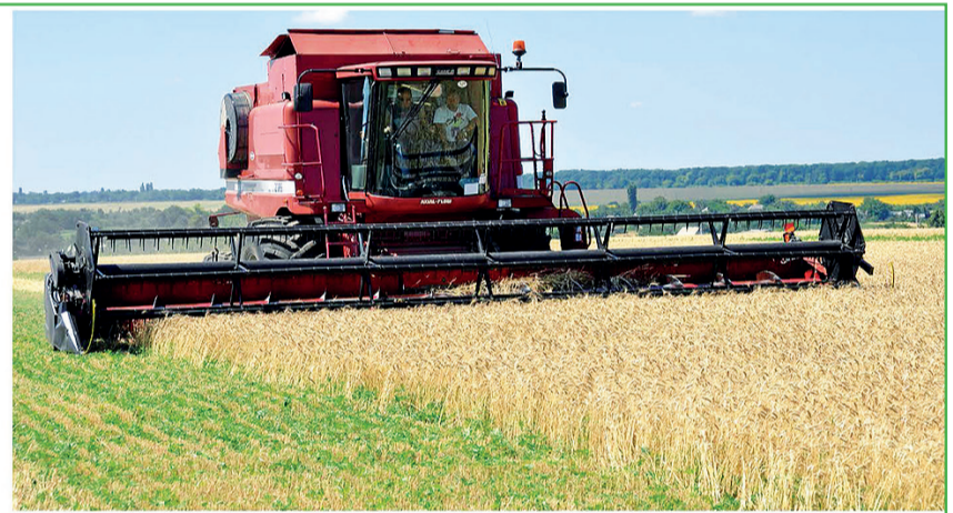
En skördetröska av det amerikanska märket Case utnyttjar det soliga vädret och kör oavbrutet under dygnets ljusa timmar.