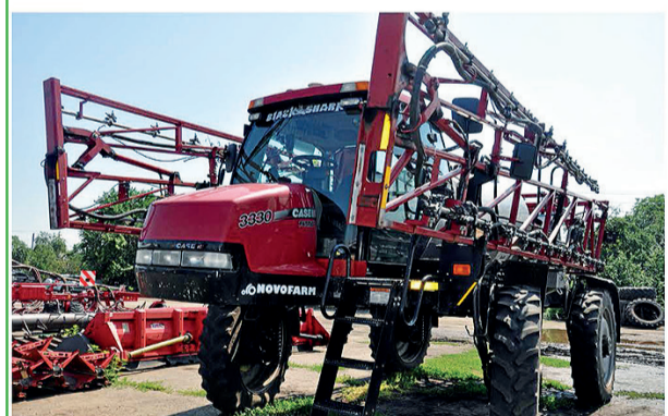
Växtskyddsprutan Case 3330 Patriot. Anatolij Gajvoronskij försöker att använda växtskyddsmedel enbart vid behov.